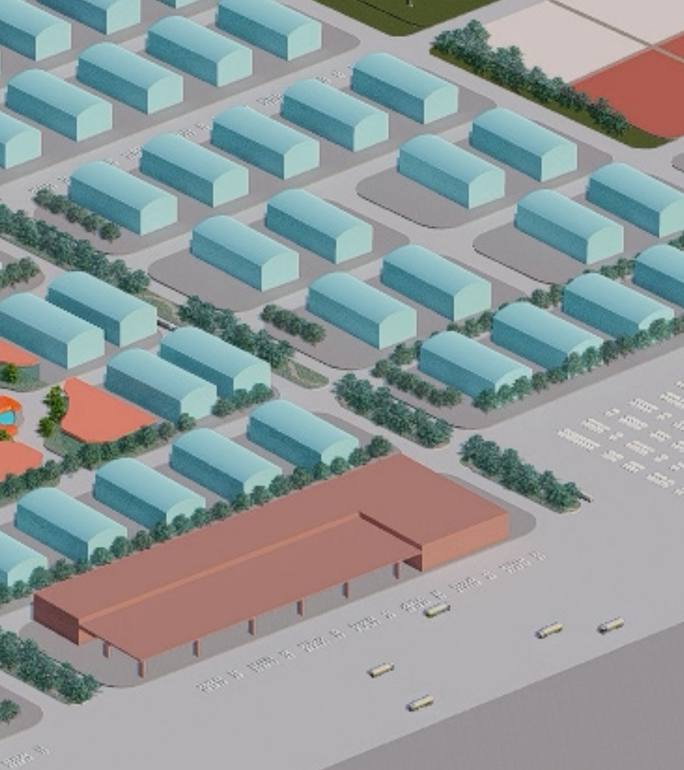
Plan Maestro del Parque Industrial para la Pequeña y Mediana Empresa (PYME)