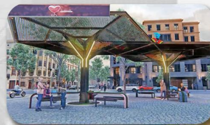
PUNTOS DE CONEXIÓN

GOBIERNO AUTÓNOMO MUNICIPAL DE Santa Cruz de la Sierra