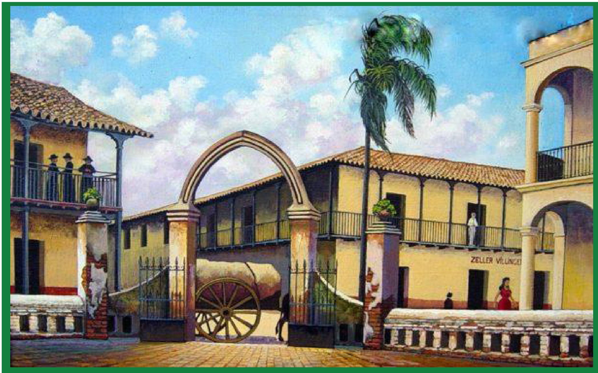
EL ALTIILLO DE LOS OBISPOS (ACTUAL ALCALDIA) Y LA CASA ZELLER VILLINGER EN LA PINTURA DE CARLOS CIRBIAN.